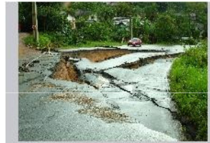
Cratera no Asfalto - DR PEDRINHO-SC