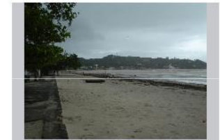
Canto da Praia, Itapema, Sc